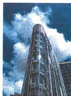
Nieuw kantoor van AkzoNobel aan de Beethovenstraat in Amsterdam.